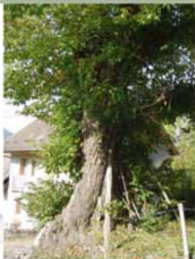
Le châtaignier séculaire