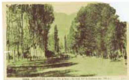
Le PRE DE FOIRE autrefois

LES COULOIRS : Ils étaient utilisés pour faire glisser et descendre les troncs d'arbres jusqu'au plus près des habitations, surtout en période hivernale, au moment des gelées.