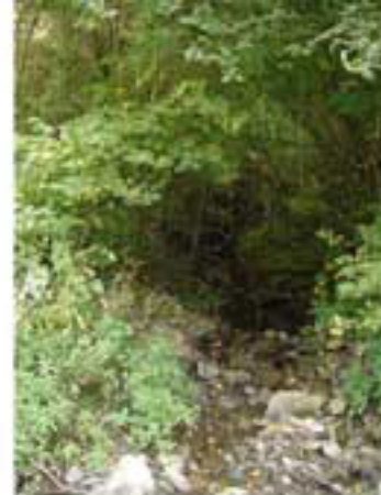
Ruisseau du MERDERET