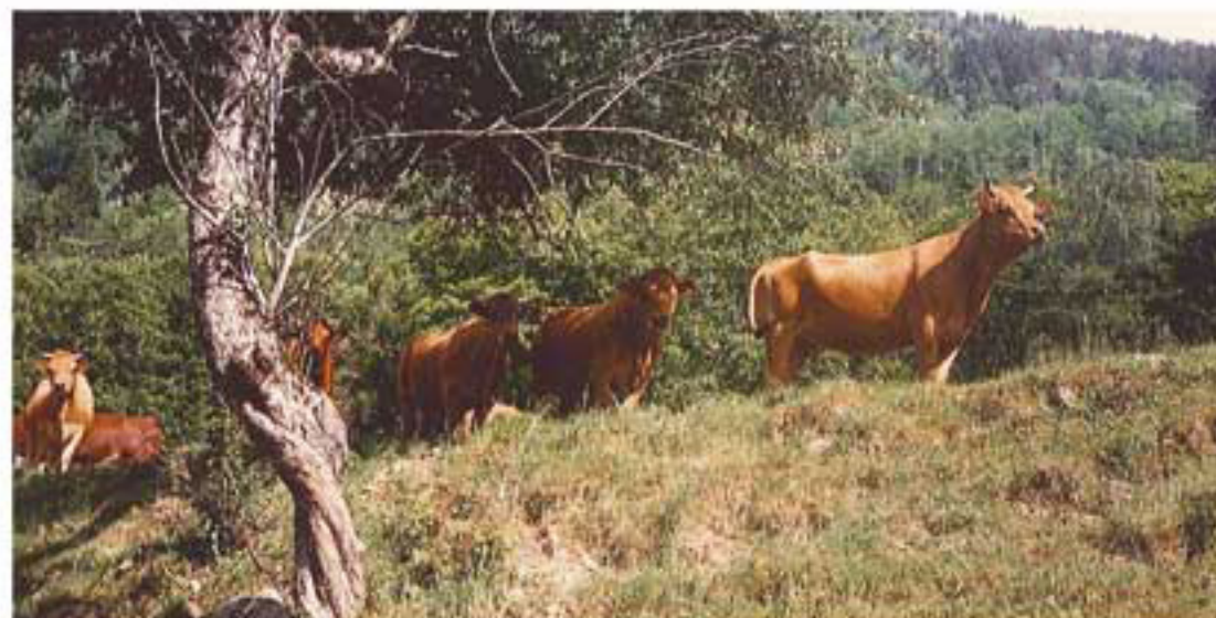
Génisses en alpage à Montchavet