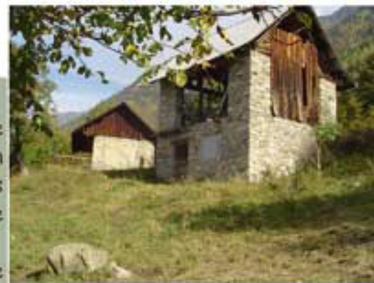
Hameau de Montchavet